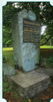
Pomnik W.I. Kirilowa