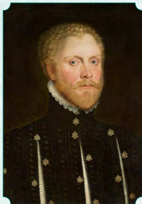
Jan z Pernsteina