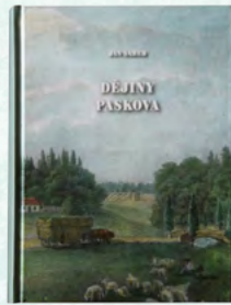
Książka Historia Paskova

Od tej pory obiekt stopniowo odzyskuje swoją dawną świetność. Obecny właściciel wraz z przychylnie ustosunkowaną władzą gminną, to podstawa zachodzących zmian, które przeistaczają paskovski zamek na administracyjne i społeczno-kulturalne centrum otwarte nie tylko dla tutejszych mieszkańców, ale również dla osób z bliskiej i dalszej okolicy. Licznie odbywające się tutaj imprezy kulturalne oraz projekty realizowane wraz z partnerami zagranicznymi i osobami zainteresowanymi są przykładem zmian do jakich doszło w ostatnich latach. Wystawy grup artystów-plastyków ze Słowacji i Polski, nawiązanie współpracy z polskim miastem Pszczyną, to tylko niektóre z nich.