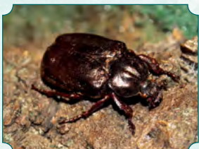
Chroniony chrząszcz pachnica dębowa

Od 2013 roku teren parku zamkowego o powierzchni 17 ha został objęty ochroną na nazwę „Zabytek Przyrody Paskov”. Bliższe informacje na ten temat znajdują się na kilku tablicach dotyczących zabytków przyrody. Zagadnieniom parku zamkowego poświęcono też tablicę nr 7 systemu informacyjnego „Ciekawostki z historii Paskova”, która znajduje się w zachodniej części, przy wejściu od ulicy U Parku. Nie lada atrakcją turystyczną paskovskiego parku, a właściwie całego obszaru zamkowo-parkowego, jest zespół rzeźb, który na terenie pogranicza północno-wschodnich Moraw i Śląska należy do wyjątkowych. Przed główną bramą przedzamcza