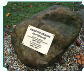
Glaz narzutowy z tablicą pamiątkową