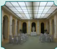
Atrium na parterze zamku