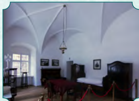
Ekspozycja poświęcona Edmundowi Reitterowi