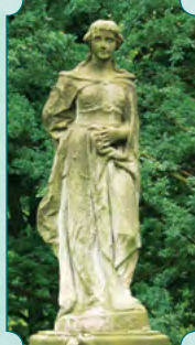
Eris, bogini niezgody i chaosu