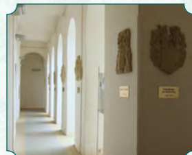
Galeria Herbowa Właścicieli Paskova