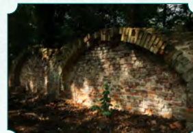
Fragment muru nad rzeką Olešną