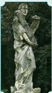
Tyche, bogini szczęścia i ślepego losu