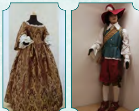
Eksponaty dotyczące historii Paskova