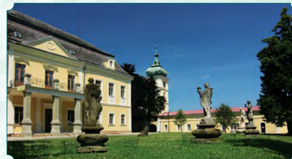
Widok ogólny zamku od strony parku, na pierwszym planie grupa rzeźb

Ciekawostkę znajdującą się w zachodniej części parku, na prawym brzegu rzeki Olešná, stanowi fragment ceglano-muru, którego pierwotnym celem w okresie baroku było wyznaczenie granicy parku zamkowego i jego ochrona.