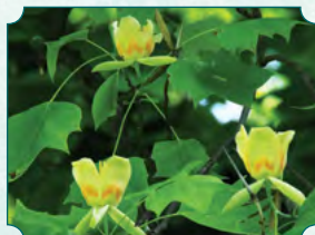
Kwiat tulipanowca amerykańskiego