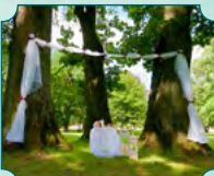
Uroczystość ślubna w parku