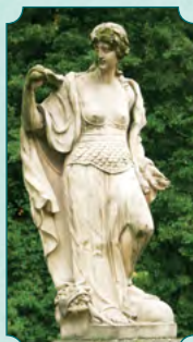
Atena, bogini mądrości

W 2005 roku park otrzymał status obszaru objętego ochroną przyrody w ramach europejskiego programu Natura 2000. Przedmiotem ochrony stała się przede wszystkim pachnica dębowa. To gatunek dużego chrząszcza dorastającego do 40 mm, który zamieszkuje dziuple drzew. Jego nazwa pochodzi od wydzielanego charakterystycznego mocnego zapachu piżma. Jego ochrona polega na zachowaniu starych drzew dziuplastych, gdzie ma swoje siedlisko. O ile dojdzie do wywrócenia takiego drzewa lub jego przycinki, przez następne trzy lata pozostaje ono nieruszone na swoim miejscu, żeby chrząszcz znalazł nowe stanowisko. Tak więc odwiedzający park mogą natknąć się w kilku miejscach na leżące pnie