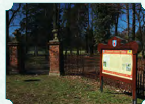
Brama od ulicy U Parku z tablicą informacyjną