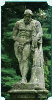
Bohater antyczny Herkules