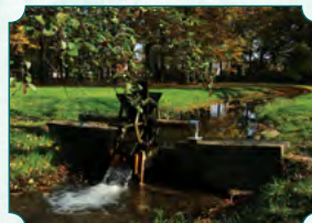
Młyn wodny na cieku Řički