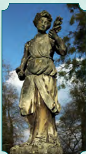
Nike, bogini zwycięstwa