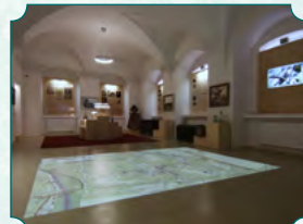
Ekspozycja dotycząca historii Paskova