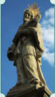
Święty Jan Nepomucen